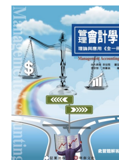
書號：41 (全一冊) 包含十六章課文及課本習題解答 審定者：幸世間教授 作者：李宗黎、林蕙真老師 定價：700 元 教學配件：投影片、題庫、講義