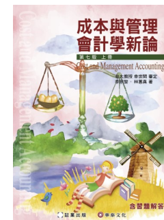
書號：4 (上、下冊) 包含二十四章課文及課本習題解答 審定者：幸世間教授 作者：李宗黎、林蕙真老師 定價：上下冊各 700 元 教學配件：投影片、題庫、講義