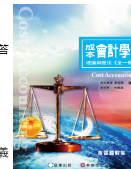
書號：42 (全一冊) 包含十六章課文及課本習題解答 審定者：幸世間教授 作者：李宗黎、林蕙真老師 定價：720元 教學配件：投影片、題庫、講義