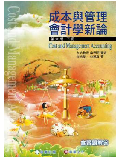
定價 $680 ISBN 978-986-7473-74-5