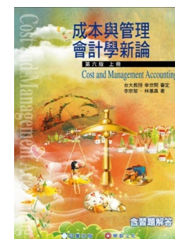
書號：4（上、下冊） 包含二十四章課文及課本習題解答 審定者：幸世間教授 作者：李宗黎、林蕙真老師 定價：上下冊各 680 元 教學配件：投影片、題庫、講義