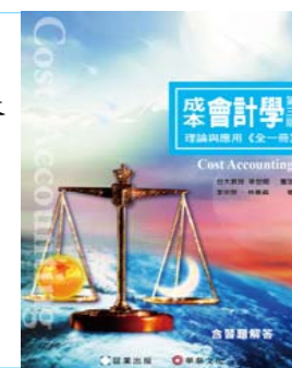
書號：42（全一冊） 包含十六章課文及課本習題解答 審定者：幸世間教授 作者：李宗黎、林蕙真老師 定價：720 元 教學配件：投影片、題庫、講義